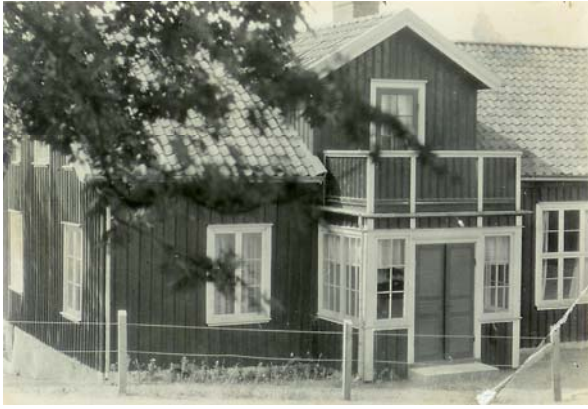
Foss Kyrkskola, Munkedal år 1935