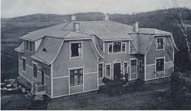
Provinsialläkarbostället Sandklev i Håby som det såg ut vid 1900-talets början