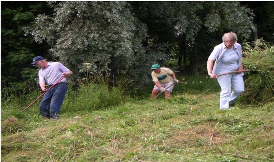
Medlemmar i full slätteraktivitet