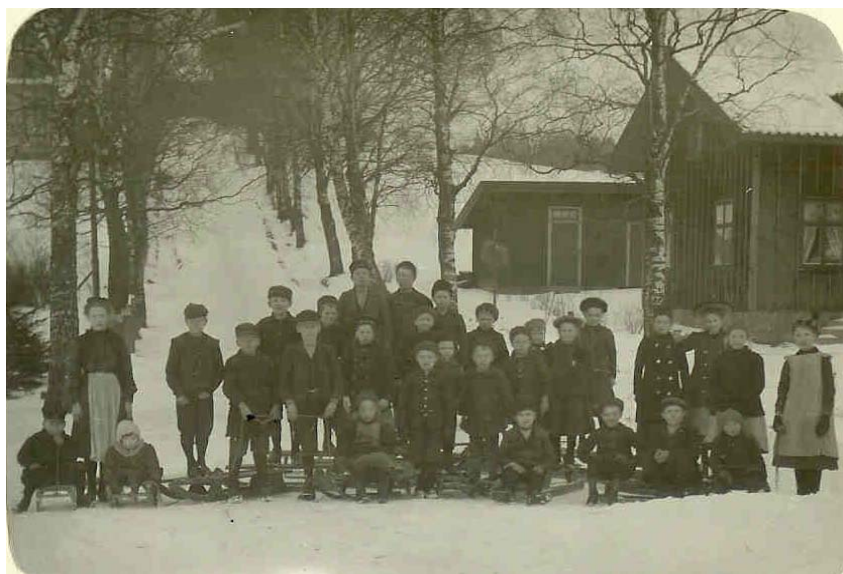
Önnebacka gata cirka 1907