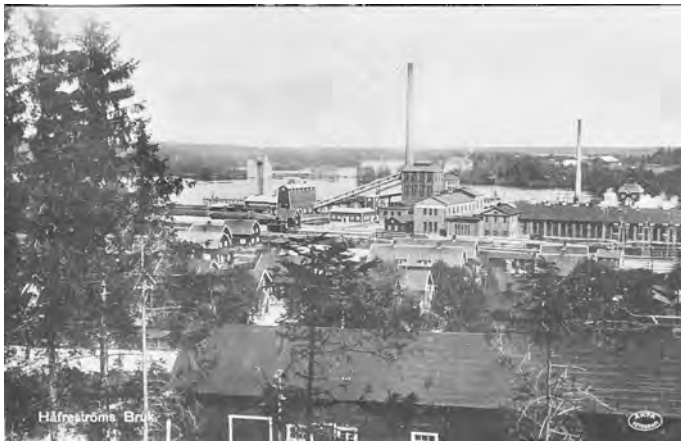
Vykort över Håfreströms bruk ca 1920.

1927 invigdes en sulfitmassa-fabrik med kapaciteten 6 000 årston och fyra år senare infördes blekning. På 1930-talet genomgick fabriken en omfattande modernisering och under åren 1951-1955 skedde omfattande ny- och ombyggnader. Bland annat ökade produktionen av sulfitmassa. 1952 började Åsensbruk tillverka maskinbestruket finpapper och blev först i Nordeuropa med sådan tillverkning.