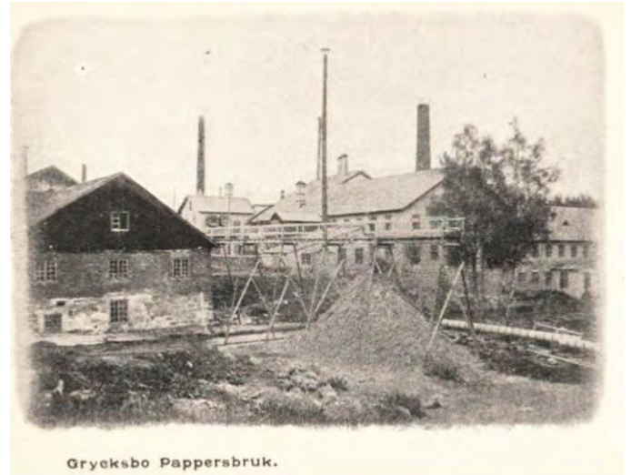
Grycksbo pappersbruk ca 1900.

I Grycksbo norr om Falun anlade Johan Munktell 1740 ett handpappersbruk. 1836 kom den första pappersmaskinen på plats och tillverkning av slipmassa startades i liten skala. 1887 bildades J.H. Munktells Pappersfabriks AB, som väsentligen var ett familjeföretag. Produktionen var cirka 200 årston papper. 1889 ersattes den gamla pappersmaskinen med en begagnad från Holmens Bruk och året efter installerades en nytillverkad och modern pappersmaskin.