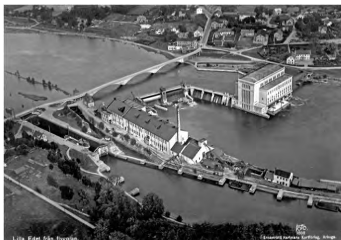
Vykort från ca 1930 som visar Inlands pappersbruk beläget på en holme i Göta älv, mellan kraftverket och slussen.

Fabriken återköptes från staten 1925. Sex år senare