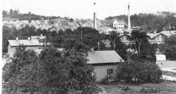
Munkedals bruk 1927

fransk-tyska kriget 1871-1872, så ändrades planen. Den tyska ingenjören Heinrich Voelter, som utvecklat en slipstol baserat på Gottlob Kellners uppfinning, var aktivt involverad under den första tiden. Han övertalade bolagsledningen att i stället för att sälja slipmassan, så skulle man tillverka papp och omslagspapper utan inblandning av lumpmassa. Sannolikt var detta första gången i världen som någon hade tagit detta steg.