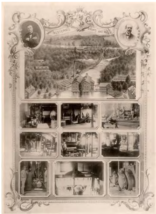
Alstermo Bruk presenterat i bildverk omkring år 1900. "Sveriges industri-dess stormän och befrämjare". ( https://sv.wikipedia.org/wiki/Alstermo_bruk#/media/Fil:Alstermo_Bruk_-_Sveriges_industri-_dessa_storm%C3%A4n_och_befr%C3%A4mjare.jpg )

År 1919 blev Grubbens & Co i Stockholm ägare och några år senare började man förädla pappen till resväskor. 1935 brann i stort sett hela fabriken ner, men det beslöts att bygga upp den och året efter kunde produktionen återupptas med fem pappersmaskiner. Alstermos mest kända produkt blev Unikaboxen. Förebilden kom från amerikanska matlådor för arbetare. Pappen tillverkades av så kallade vulkanfibrer, unica, som framställdes med speciella metoder och som gav ett utomordentligt starkt och tåligt material. Unikaboxarna hade, förutom som matlådor, en bred användning, exempelvis som förvaringslådor och resväskor. Nämnas bör att tillverkning av unika påbörjades redan 1898 i Aktiebolaget Tidån i Västergötland, som var ett dotterbolag till Katrinefors i Mariestad, vilket har beskrivits i NPHT 1/2018.