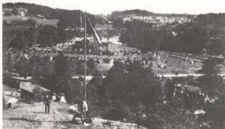
Ungdomsmötet 1908.