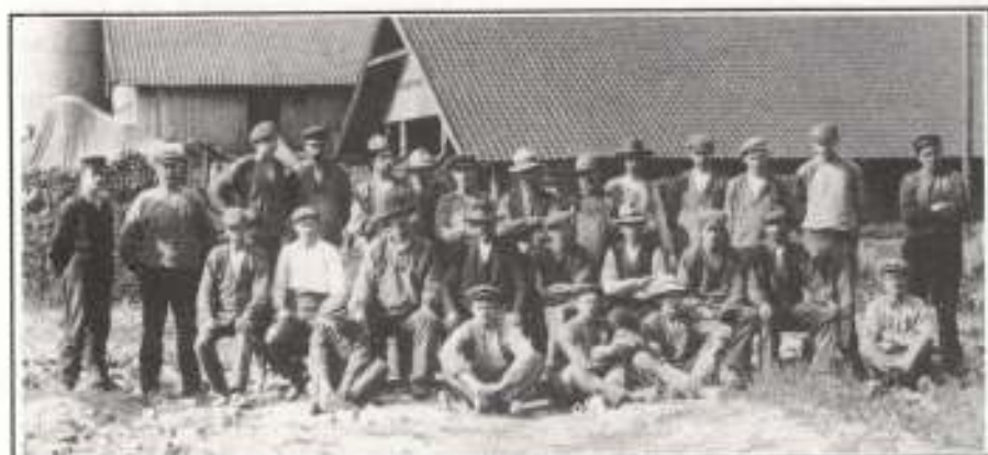
Ödsby tegelbruk 1910.