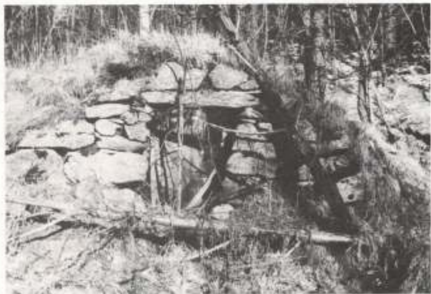
Den välmurade jordkällaren på Vindösen, Skaveröd.