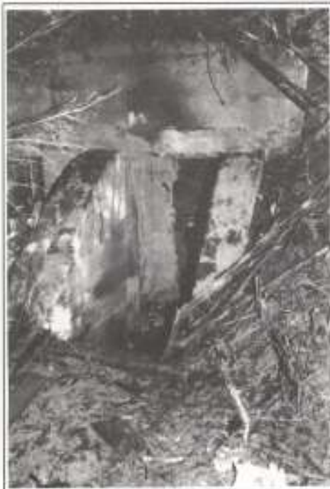
Källare gjuten i betong. Finns på Liane.